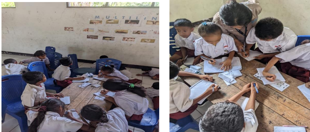
Gambar 3. Kegiatan siswa menulis kembali isi media multilingual yang telah mereka amati

Hasil dari kegiatan menulis kembali isi media multilingual yang telah mereka amati adalah