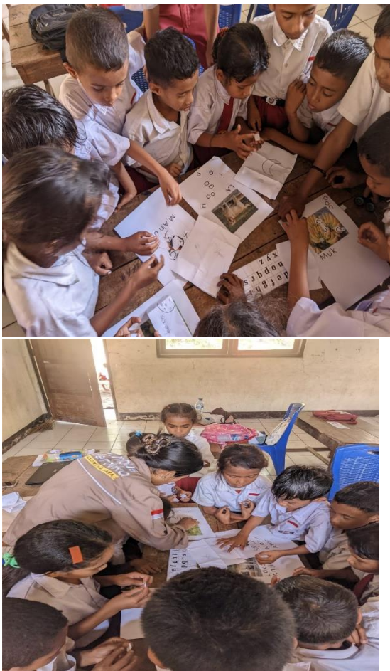
Gambar 4. Kegiatan menyusun kata