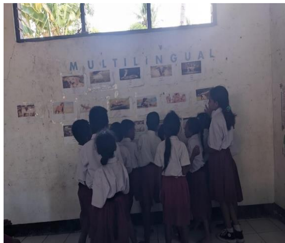
Gambar 2. Kegiatan siswa mengamati media multilingual

Hasil dari kegiatan siswa mengamati media multilingual adalah